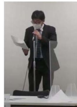
研修会での司会の様子

さて、当センターの活動の一環として、本年 1 月 28 日には、ウインクあいちにおいて境界問題相談センター運営担保研修が開催されました。まん延防止等重点措置が適用されて間もない時期であったため、少人数での開催となりましたが、本番さながらの模擬相談とその相談を受けての模擬調停が行われ、相談から調停への流れがわかりやすく、私共会員が相談員又は調停人になった際に非常に役立つ内容でした。